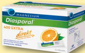
Magnesium Diasporal® 400 Extra direkt Orangengeschmack Direktgranulat, 50 Sticks