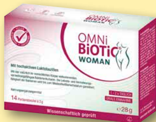
OMNI Biotic® Woman Portionsbeutel, 14 x 2 g