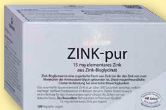
Gesundform Zink-Pur 120 Kapseln, vegan