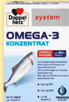
Doppelherz® system Omega-3 Konzentrat 120 Kapseln