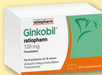
Ginkobil® ratiopharm 120 mg 120 Filmtabletten