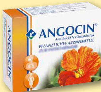
Angocin® Anti-Infekt N Filmtabletten 100 Stück