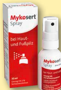
Mykosert® Spray bei Haut- und Fußpilz 30 ml