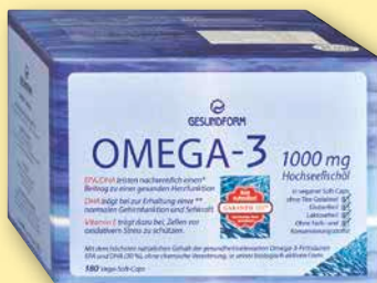
Gesundform Omega-3 1000 mg Hochseefischöl 180 Vega-Soft-Caps